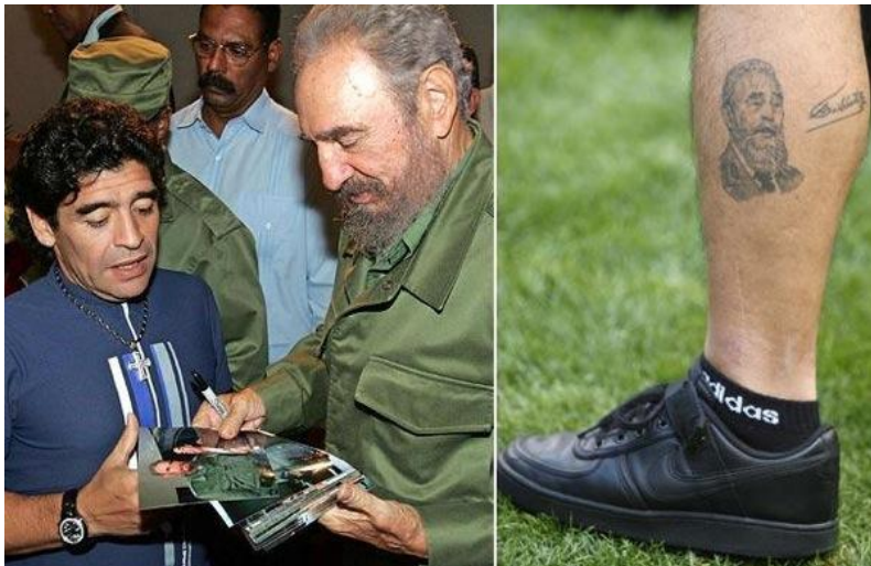
С хорошим другом Фиделем Кастро