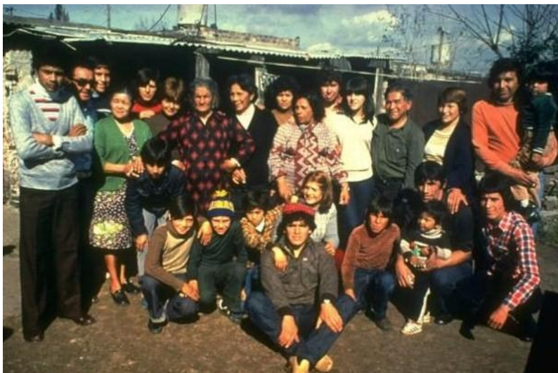
Первый парень на деревне