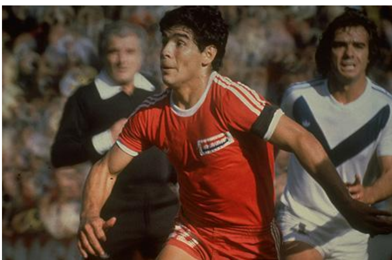
Марadona в форме "Аргентинос Хуниорс"