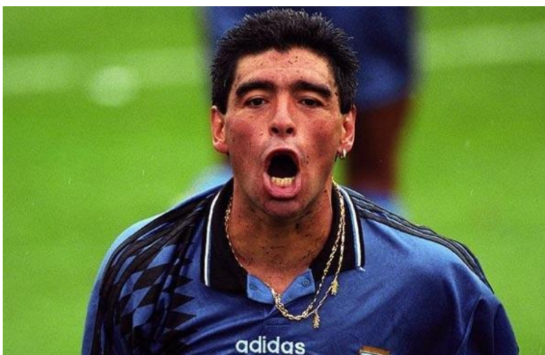
Триумфальное возвращение. ЧМ-94 гол в ворота сборной Греции