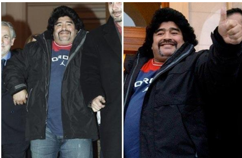
В 2005 году Марadona, вес которого при росте 165 см достиг 120 кг, согласился на операцию по уменьшению объема желудка.