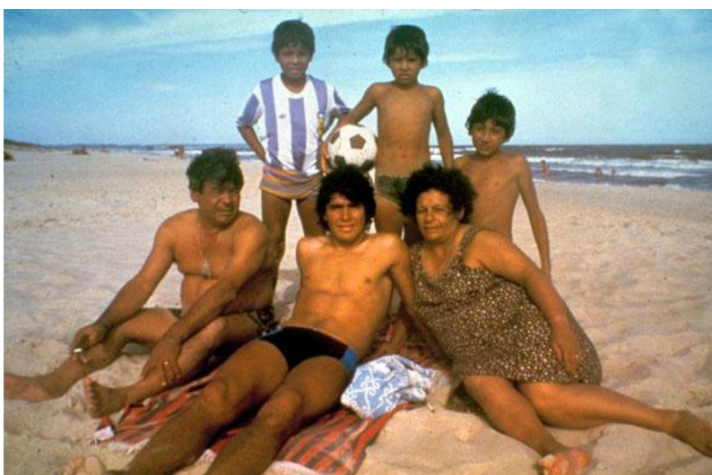
С семьей на пляже. Справа горячо любимая Тота