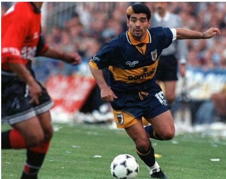
В 95-м Диего вновь примерил на себя футболку "Боки"