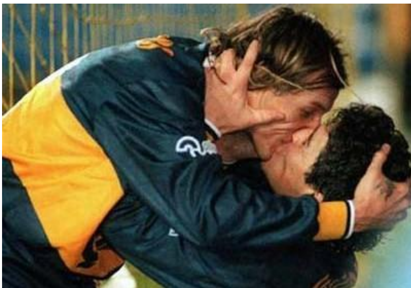
Знаменитое празднование голов с Канниджей